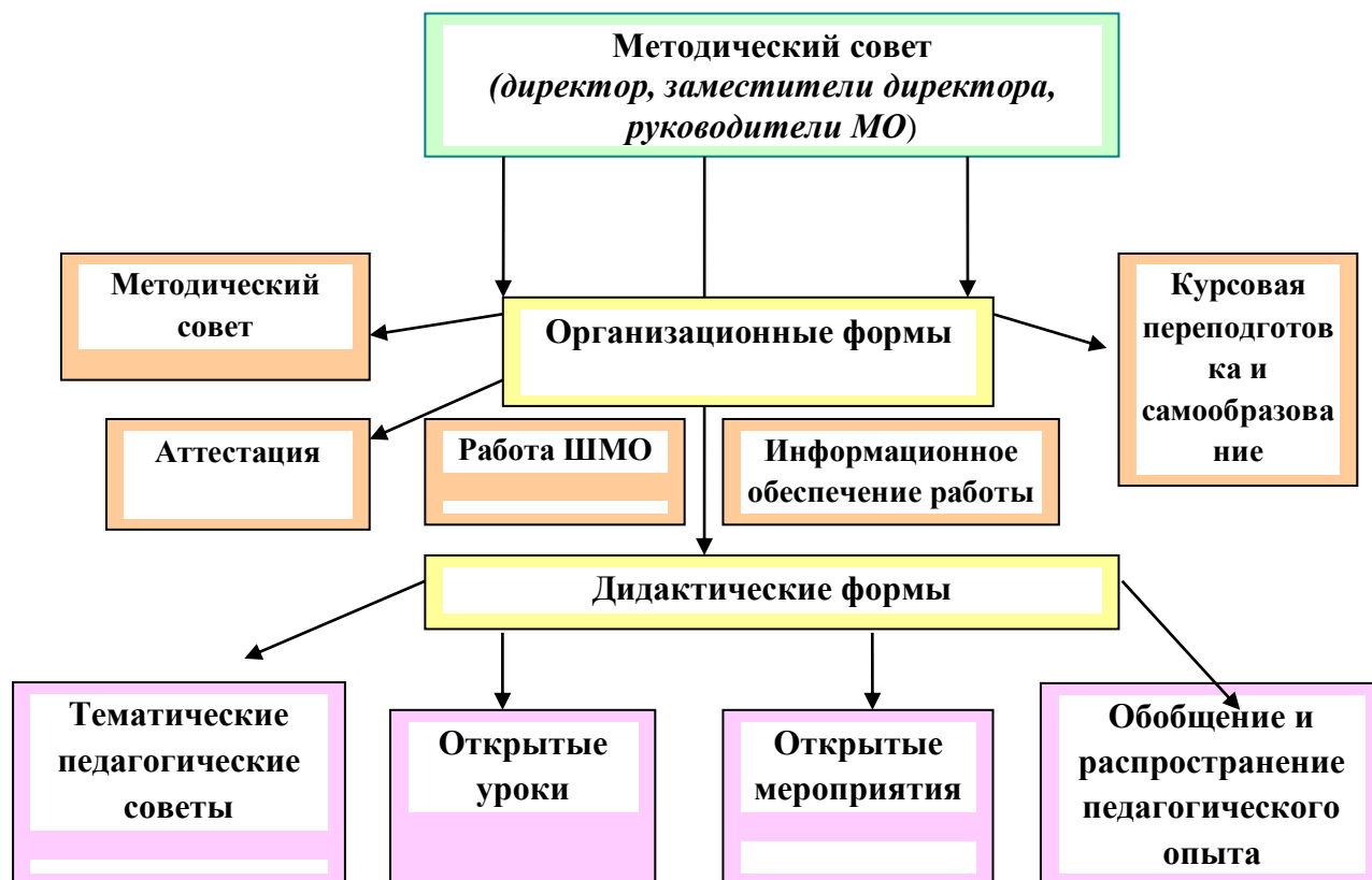
Структура методической службы

Методическая служба школы представлена педагогическим советом, методическим советом. Педагоги школы включены в ММО на базе школы функционируют два школьных методических объединения классных руководителей и учителей.