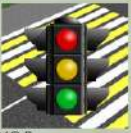
Регулируемый пешеходный переход